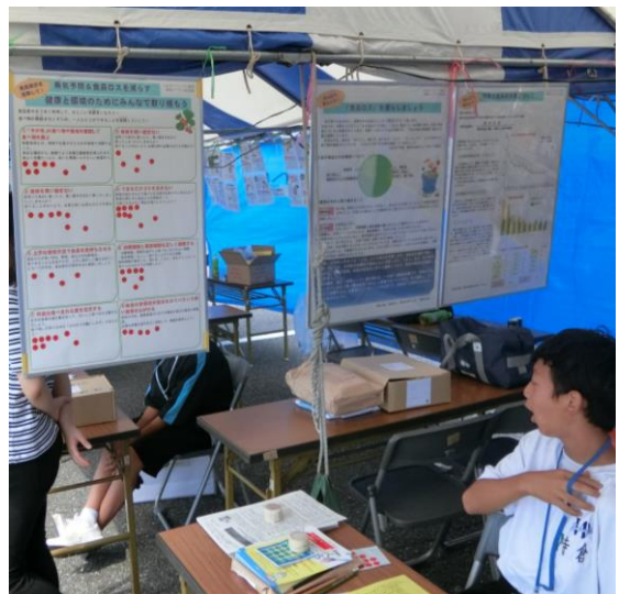
[消費者コーナーの展示の様子]