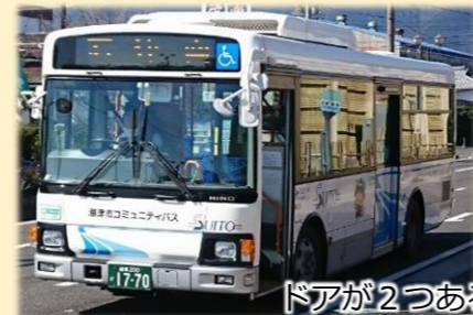
ドアが2つある場合は、前から乗車。