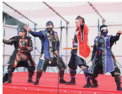
古戦場おもてなし武将隊 関ヶ原組さん