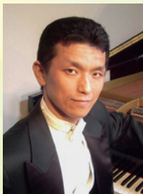
ピアノ 佐部利 弦