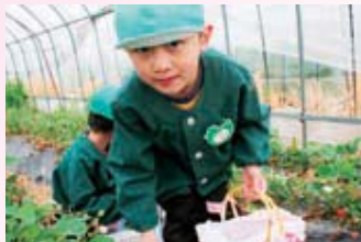
カゴいっぱいにするぞ