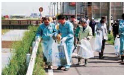
中学生や企業の方も多数参加