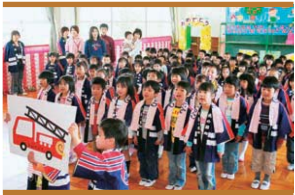
火あそびは しません