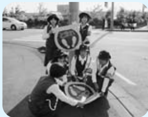
女性部のメンバーが ストップマークを設置