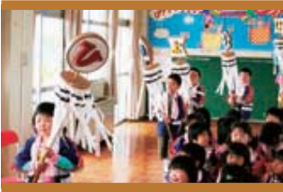
火の用心のまといを手に入場