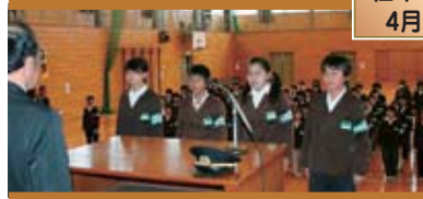
「私たちは初期消火のしかたを身につけます」