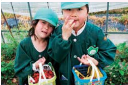
ズッシリ重くなりました