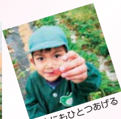
先生にもひとつあげる