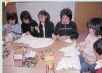
人形劇サークル「きくまる」のみなさんと一緒に遊びました