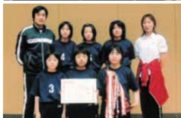
6年生の部優勝 福束バレーボール少年団