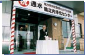
▲H16.3.30 「輪之内浄化センター」通水式