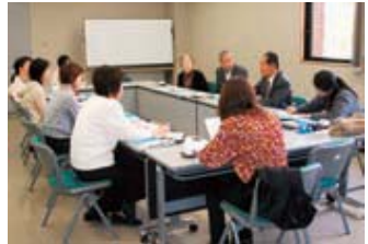
4月26日(木)テーマ図書は「千の風になって ちひろの空」