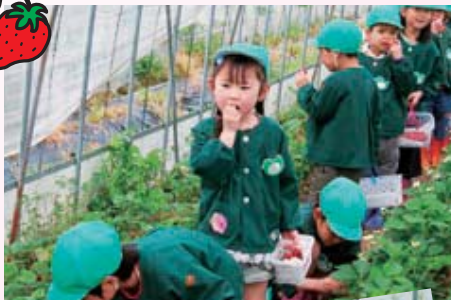
甘くておいしいね