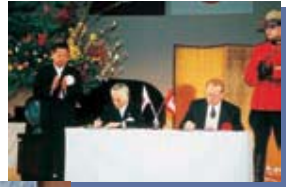
▲H11.4.10 カナダヒントン町・輪之内町 「友好親善宣言」調印式