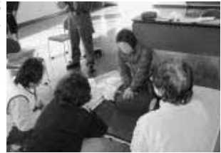
心肺蘇生法の実演講習

参加者は、心肺蘇生法や止血法などの応急手当ての方法を学び、AEDの操作を体験しました。