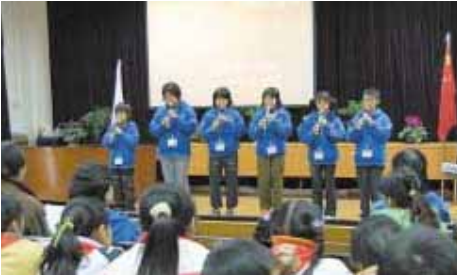
育才学校での出し物「子どもり歌」