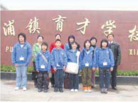
周浦鎮育才学校にて

中国派遣研修によって感じたこと、学んだことを団員が報告します。町では今年5月に上海からの訪問団を迎えます。