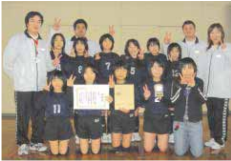
1位で予選突破 福東バレーボール少年団