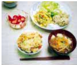
春のバランス食(5月実施)

希望される方は、保健センターまでお電話ください。なお、定員になり次第締め切らせていただきます。 でんわ69-5155