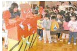
鬼に向かって「鬼は外!福は内!」