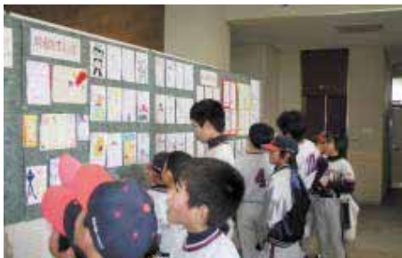
展示を楽しむ仁木野球少年団員

アニメキャラクターや動物などの絵が色彩豊かに描かれたものや、メッセージが日本語でかかれたものもあり、来庁者の目を楽しませました。