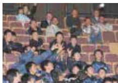
記念ボール抽選会のおうす