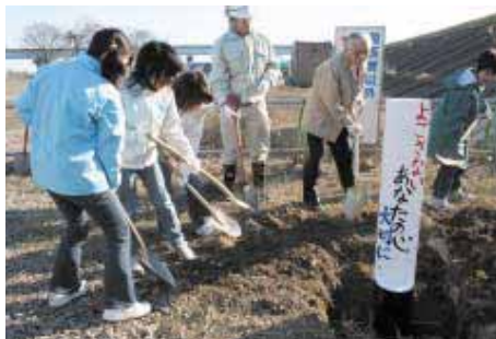
よごさない あなたの心 大切に