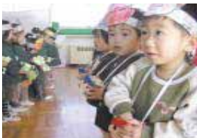
さあ、用意はいいかな?