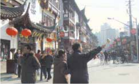
レトロな通りの豫園一帯