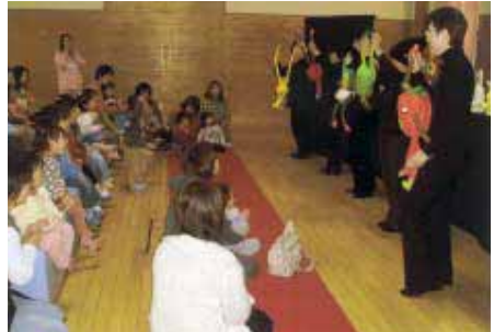
人形劇サークル「きくまる」のみなさんによる人形劇(昨年の様子)