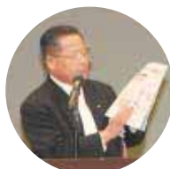
篠田会長による紹介