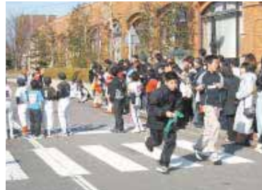
駅伝部門:5人でたすきをつなぎました