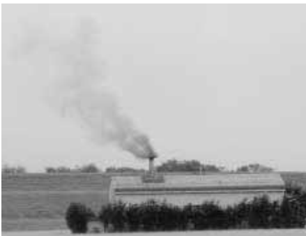
輪之内町内の火葬場

平成18年度の主な補助金として、修繕に要した費用を100%補助している「火葬場施設維持管理費補助金」では1,000万円の支出を予定しています。また、「火葬場運営費補助金」では、火葬場における電気・水道代として25万円、火葬業務に従事する人件費として206万円の支出を予定しています。