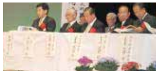
記念誌に目を通す来賓者