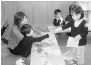
“かいものごっこ”より「100円です」「はいどうぞ」