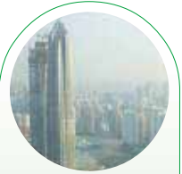
東方明珠塔から見た上海