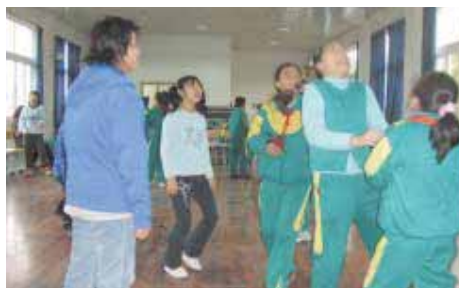
灑溪小学校の出迎えと交流

「ようこそいらっしゃいました」という日本語が、私の耳に飛びこんできました。あまりの歓迎ぶりに、おどろきました。中国の子と一緒にぎょうざ作りやジェンカをおどろ、手と手を触れ合うことにより、交流が深まった気がしました。中国の子達はとても優しく、心が温かかったです。言葉は通じなくても、心で通じ合えるように接していくことが大切だと思います。