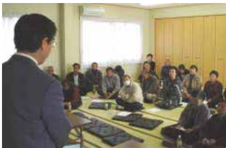
講師の話をもっと真剣に聞き入る参加者

この講習で建物を委ねるプロの選定が最重要課題であり、家族のリーダーの責務であるとの説明に参加者は熱心に聴講していました。