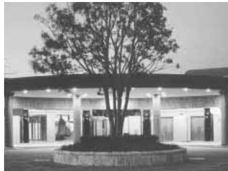
羽島市火葬場の夜景