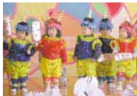
かわいい鬼さん登場