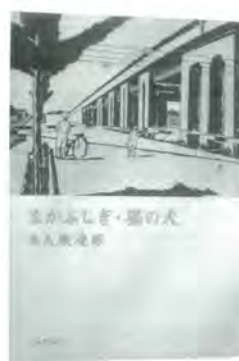
出久根 達郎 著 河出書房新社 発行

あこのころ、袖振りあつた人々の、忘れえぬ思い出身辺さまさまにまつわるエピソード、あの風景、この食べものに関する懐かしい記憶の数々が、まざまざとよみがえる。なものにもかえがたいエッセイ集です。