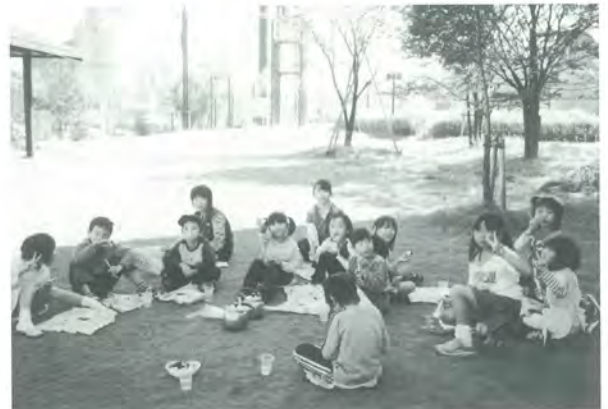
「野外ランチ」 げんきクッキングにて