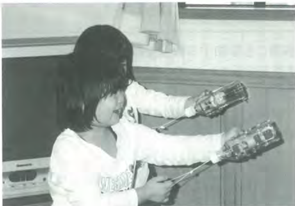
「ボールシューターを作って遊ぼう」 あそびっこにて