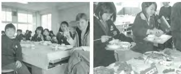
仁木小学校において (平成16年12月9日開催)