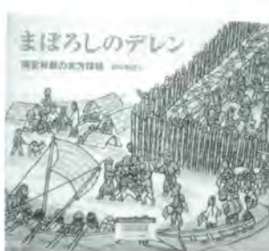
関屋 敏隆 さく 福音館書店 発行

探検は夢と勇気を与えてくれる！間宮林蔵はカラフトと大陸を探検し、北方の民族が生き生きと交流している姿を目撃する。探検家をテーマにした絵本です。