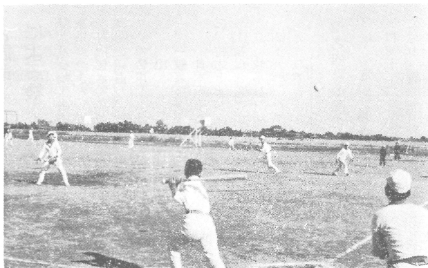
好打の一撃 センター構えた果して球は？ (ソフトボール大会)

スポーツ少年団員によるソフトボール大会は、晴天の十月二十九日の午後に行なわれました。各小学校と中学校で予選をして、決勝戦の男子女子の二試合が中学校庭で競われ、男子の部、女子の部とも練習期間が少なかつたにもかかわらず随所に好打、好守がとび出し、男女共に大熱戦となり、結局優勝は男子六分団、女子は五分団で二位は男子九分団、女子は四分団でした。