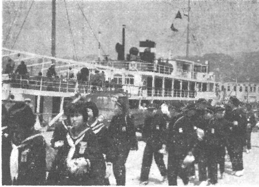
船につて、神戸港より大阪に向う 輪之内中学校三年生徒たち

◎輪之内中学校では五月九・十・十一日と二泊三日で三年生が京都、神戸、大阪、奈良方面に修学旅行を又全月十一日に一年生は小牧、名古屋方面に、二年生は四日市・湯之山方面に社会見学に出かけました。全校一同事故なくそれぞれ行事の目的を達成しましたことを喜んで居ります。見学年内容並に参加態度については各学年各級で反省し、勉学の、はげみとすることにも、お互いの態度、約束の実行については、その反省を今後の日常生活に有効に生かすよう努めます。