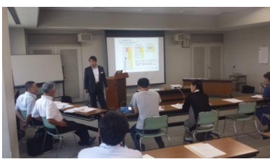
ワークショップ風景（イメージ）